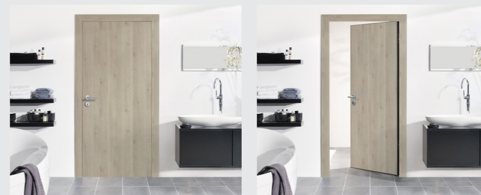
Invers öffnende Türen zur perfekten Anpassungen an räumliche Gegebenheiten.