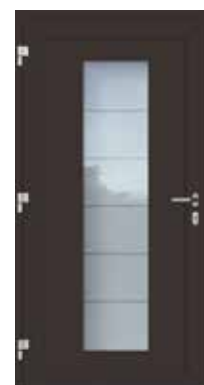
All'interno / Inside