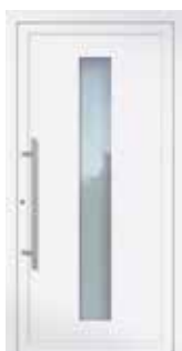
Altezza / High 2.000 mm

Le immagini originali presenti all'interno di questa brochure corrispondono ad una porta con dimensioni 1.100 x 2.100 mm. Le misure dei disegni (dei pannelli vetro) rimangono sempre le stesse in altezza per cui non sono personalizzabili. Di conseguenza, se l'altezza della porta dovesse essere diversa verranno aumentati o diminuiti i pannelli angolari della parte superiore ed inferiore.