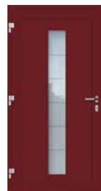
All'interno / Inside