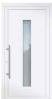
Altezza / High 2.240 mm